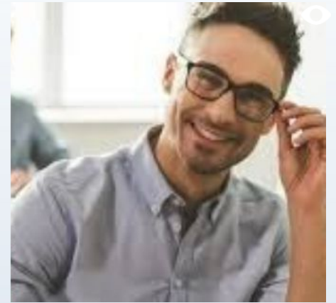
Aprendizaje y desarrollo